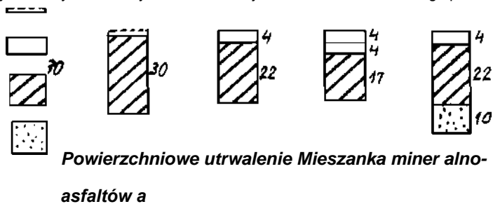
Rys. 4. Przykładowe wybrane konstrukcje nawierzchni utwardzonego pobocza z kruszywa łamanego niezwiązanego

Kruszywo łamane niezwiązane (stabilizowane mechanicznie) Grunt stabilizowany